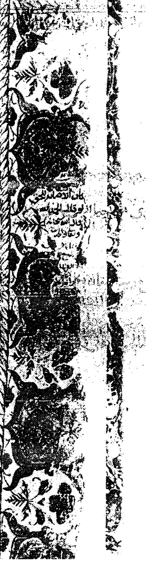
الورقة الأولى / ب من النسخة (خب)